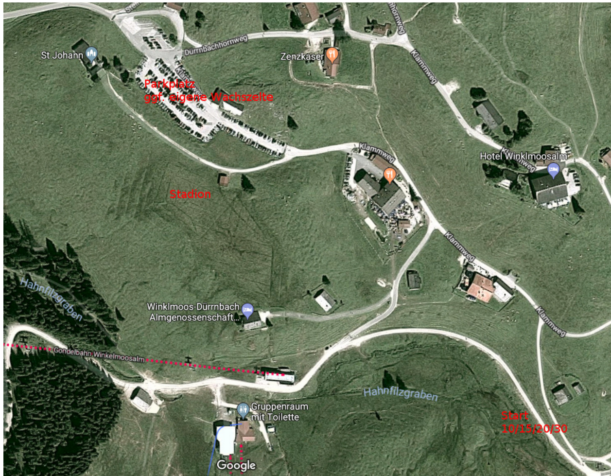
Lageplan Winklmoos. Interaktiv: https://goo.gl/maps/kuDNt75K2P62